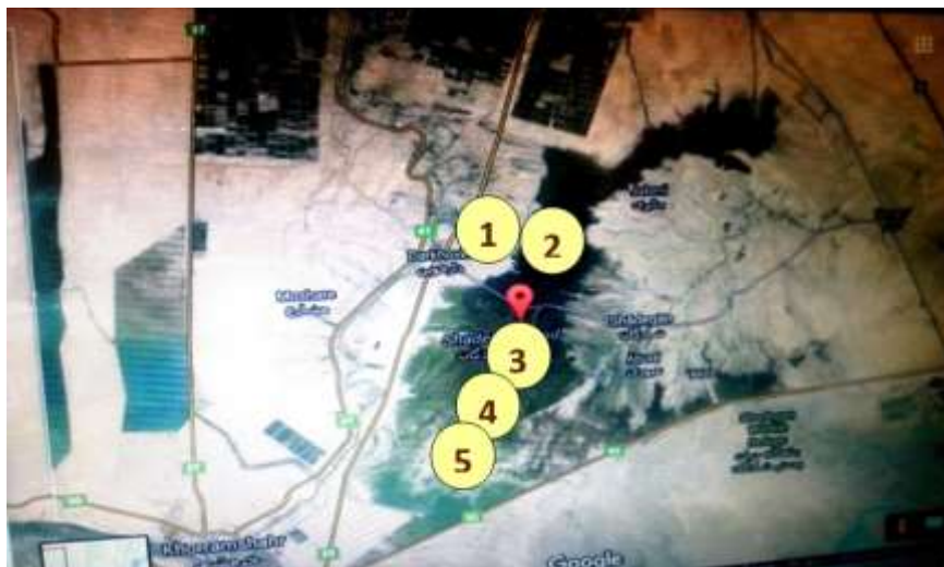
شکل ۲: نمونه‌برداری در تالاب شادگان، خوزستان، ایران سال ۱۳۹۰.

ریسک اکولوژیکی، غلظت اثر زیست‌محیطی (EEC) ۵ آفت‌کش (ددت، آلدین، دی‌الدرین، آمترین و لیندان) در ۵ فضای سه‌بعدی (Compartment) از آب‌های شور و شیرین اندازه‌گیری شد (اصطلاح فضای سه‌بعدی به دلیل نمونه‌برداری در تالاب که دارای طول، عرض و ارتفاع بوده و دارای حجم است به‌کاربرده شده است). این آفت‌کش‌ها به‌عنوان یک تجزیه و تحلیل‌گر هدف بر اساس استفاده در صنعت توسعه نیشکر در منطقه و کاربرد آن‌ها انتخاب شده‌اند. به نظر می‌رسد که استفاده از آفت‌کش‌های ارگانوکلره در ایران از سال ۱۹۸۳ ممنوع شده اما این روند همچنان ادامه دارد. انتخاب فضای سه‌بعدی بر اساس جریان، شوری آب و توپوگرافی بستر صورت می‌پذیرد. اولین فضای سه‌بعدی به‌طور تقریبی در محل خروجی توسعه نیشکر و آخرین فضای سه‌بعدی در فاصله دورتر از خروجی‌ها و در محور طولی هم‌دیگر قرار دارند. تمامی این فضاهای سه‌بعدی در (شکل ۲) نشان داده شده‌اند. مختصات این نقاط در (جدول ۱) آمده است. نمونه‌برداری آب به‌طور فصلی (بهار، تابستان، پاییز و زمستان ۱۳۹۰) و در ۵ فضای سه‌بعدی نمونه‌برداری صورت پذیرفت. نمونه‌های تکرار یافته در عمق ۰/۵ متری با استفاده از بطری‌های آب برداشته شدند. نمونه‌ها در دمای ۴ درجه سانتی‌گراد و به مدت ۴۸ ساعت جهت تجزیه و تحلیل ذخیره شدند. جمع‌آوری تمامی نمونه‌ها بر اساس استانداردهای کنترل کیفیت (QC) و تضمین کیفیت (QA) صورت پذیرفت.